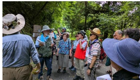
北近畿探訪講座 フィールドワーク三和のPT境界線（古生代・中世代の境目）を歩く