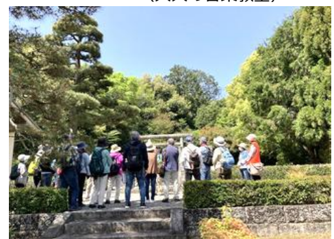
校外講座例 (ぶらり京都のまちあるき)