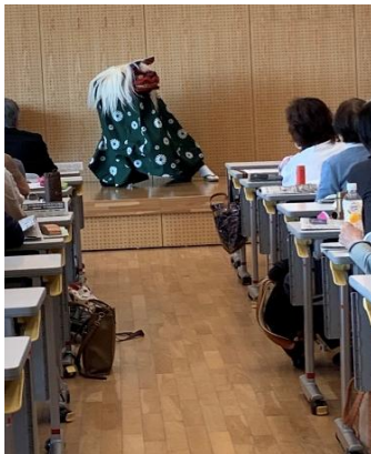
寄席芸鑑賞講座 太神楽を学び楽しむ