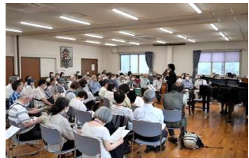
座学講座例 (大人の音楽教室)