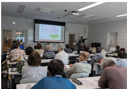
時事問題や歴史講座、漢字学講座など座学の講座風景